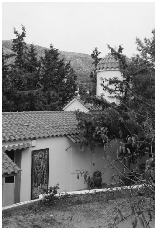
Ἱ.Μ. Τιμίου Προδρόμου, Κουβαράς.