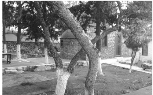
Ἱ.Ν. Ἁγ. Παναγίας Δρενιᾶς.

(Ἐγκύκλιος Δημητριάδος Γερμανοῦ καὶ πρ. Φλωρίνης Χρυσοστόμου, 1937)