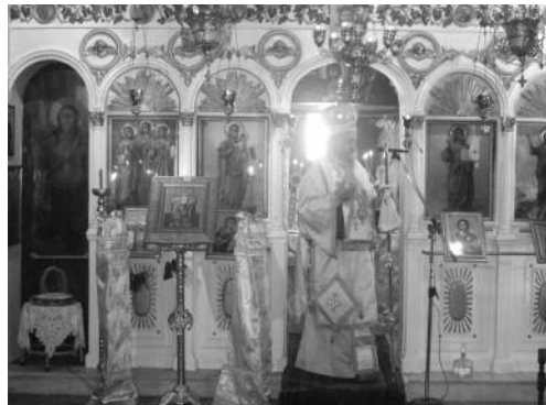
Ἱ.Ν. Ἁγ. 3ων Παρθένων, Ἀθηνῶν.