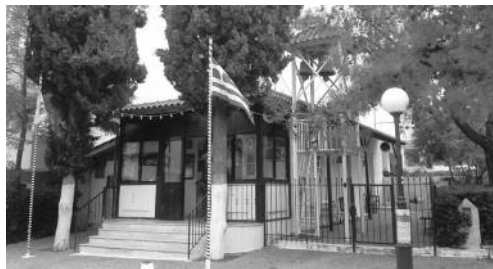
Ἱ.Ν. Ἁγ. Ἀναγύρων, Ν. Ἐρυθραίας.

(Ἐπιστολή / Ἀπολογία τοῦ ἐν ἐξορία εἰς τὴν Ἱ.Μ. Ἁγ. Διονυσίου διατελοῦντος πρ. Φλωρίνης Χρυσοστόμου, 1935).