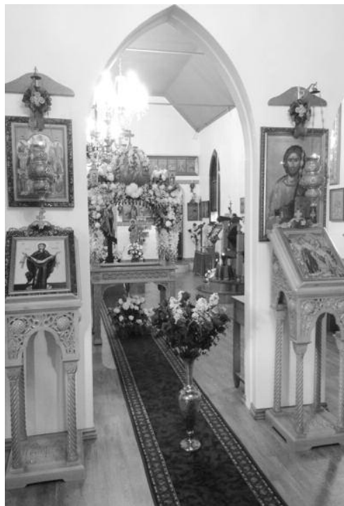
Ἱ.Ν. Ἁγίας Σκέπης, Αυστραλία.