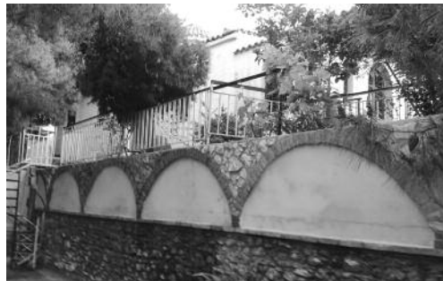
Ἰ.Ν. Ἄγ. Μηνᾶ, Σαλαμίνοσ.

(Ἐπιστολῆ/Ἀπολογία τοῦ ἐν ἐξορίᾳ εἰς τήν Ἰ.Μ. Ἄγ. Διονυσίου διατελοῦντος πρ. Φλωρίνης Χρυσοστόμου, 1935).