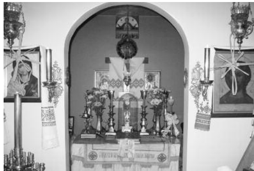
Ἱ.Ν. Ἀγ. Μηναῖ, Η.Π.Α.

(Ἐπιστολὴ πρ. Φλωρίνης πρὸς τοὺς διανοοῦμενους).