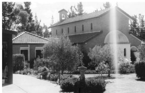
Ἱ.Ν. Ἁγ. Εἰρήνης Χρυσοβαλάντου, Αὐστραλίας.

(Ἀναίρεσις τοῦ πρ. Φλωρίνης Χρυσοστόμου εἰς ἡμερολ. πραγματεία Μητρ. Δωροθέου Κοτταρᾶ)