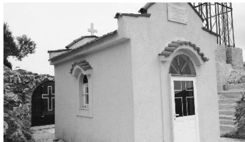
Ἰ. Παρεκκλήσιο Ἀναστάσεως Κυρίου, Κουβαρά.

(Ἐπιστολή / Ἀπολογία τοῦ ἐν ἐξορία εἰς τὴν Ἰ.Μ. Ἁγ. Διονυσίου διατελοῦντος πρ. Φλωρίνης Χρυσοστόμου, 1935).