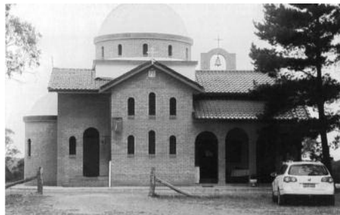
Γ.Ν. Ἁγ. Φανουρίου, Αὐστραλία.