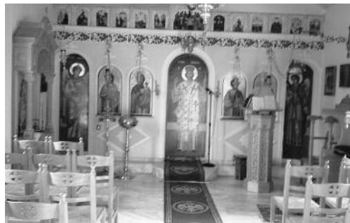
Ἱ.Ν. Ἁγ. Κυριακῆς, Κουβαράς.

(Ἀνοικτὴ ἐπιστολὴ πρ. Φλωρίνης πρὸς τὸν Ἀρχιεπ. Ἀθηνῶν Σπυριδῶνα Βλάχον, 1950)