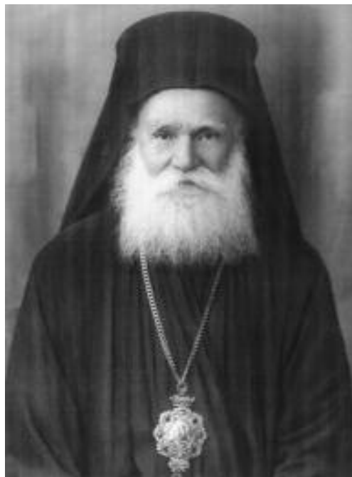
Ο ΠΡ. ΦΛΩΡΙΝΗΣ ΧΡΥΣΟΣΤΟΜΟΣ (ΚΑΒΟΥΡΙΔΗΣ) + 1995

Ἦρωσ ἀκλινῆς τῆς ἀληθείας ἐφάνης, Βέλος Ὁρθοδοξίας πῆξας καρδίας ἐσκοτισμέναις. Πίστιν πατρῶαν τῇ εὐσεβείᾳ στηρίξας, ὄντως Μητρός Ἐκκλησίας στύλος ἐδέχθης. Χαίρων ἀπῆλθες νίκης φέρων στέφος ἰσοκλεές τῇ δόξῃ ἐκλεκτῶν Κυρίου... (Μοναχοῦ Μάρκου Χανιώτη)